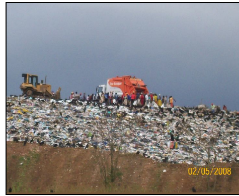
Figura 2: Circulação de pessoas durante o despejo de lixo no vazadouro da Codin

Ainda de acordo com o artigo 2º, essas atividades devem obter aprovação e licenciamento junto ao órgão estadual competente e ao IBAMA.