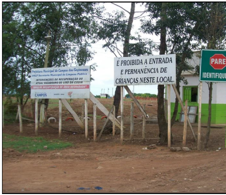
Figura 1: Vazadouro da Codin