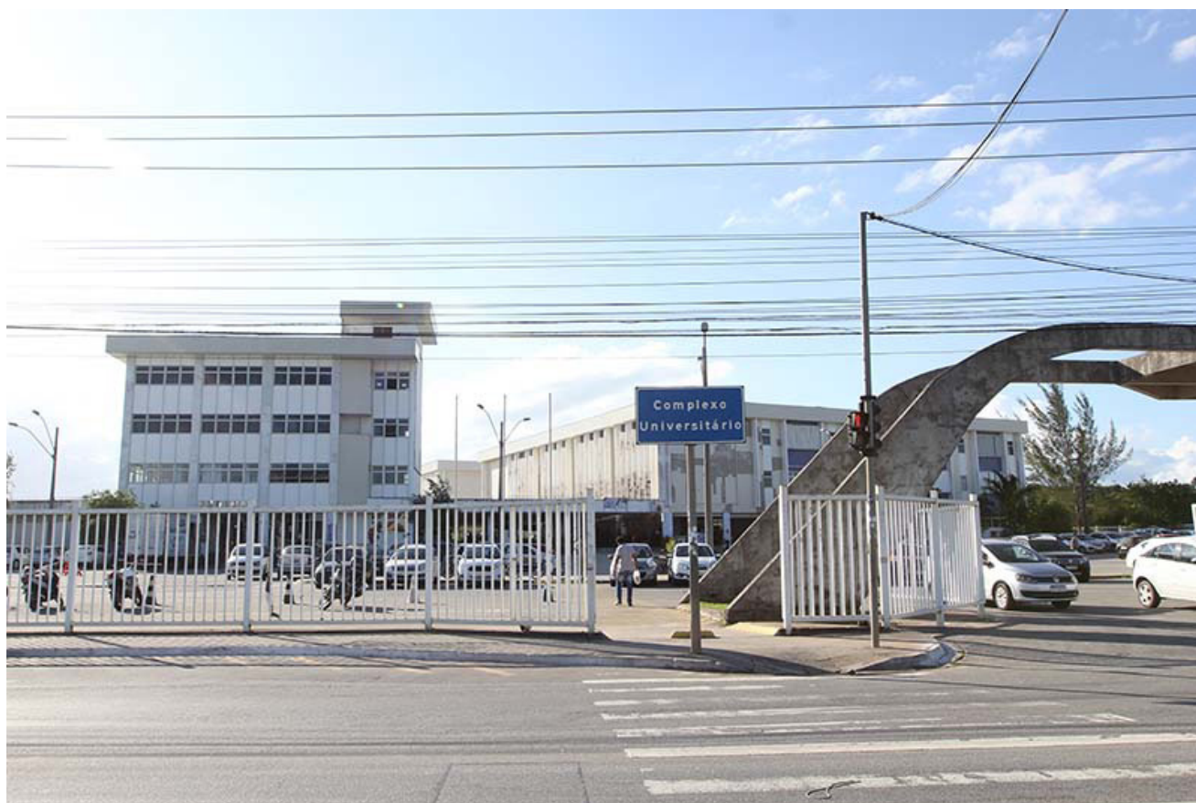
Figura 2. Fachada do Complexo Universitário de Macaé

A fachada do Complexo Universitário de Macaé está ilustrada na Figura 2.