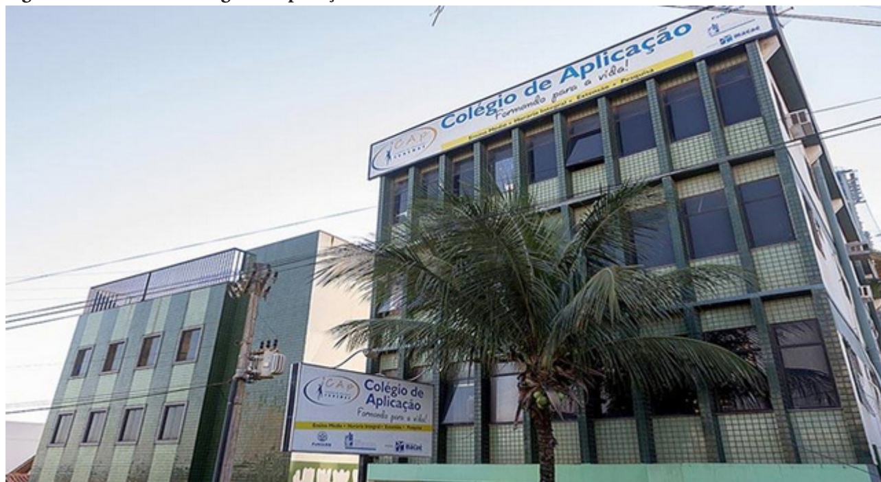
Figura 1. Fachada do Colégio de Aplicação

A fachada do CAp em sua sede anterior está ilustrada na Figura 1.